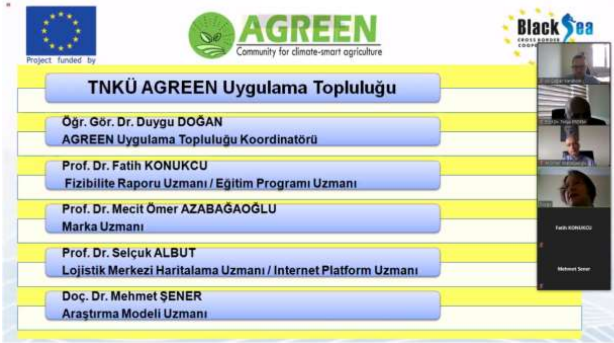
Ekran Görüntüsü 3