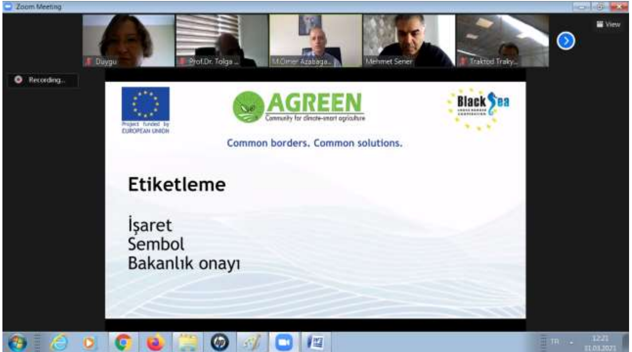
Ekran Görüntüsü 6