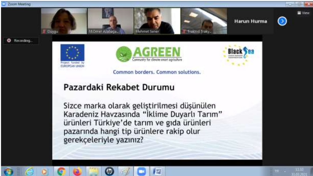
Ekran Görüntüsü 4