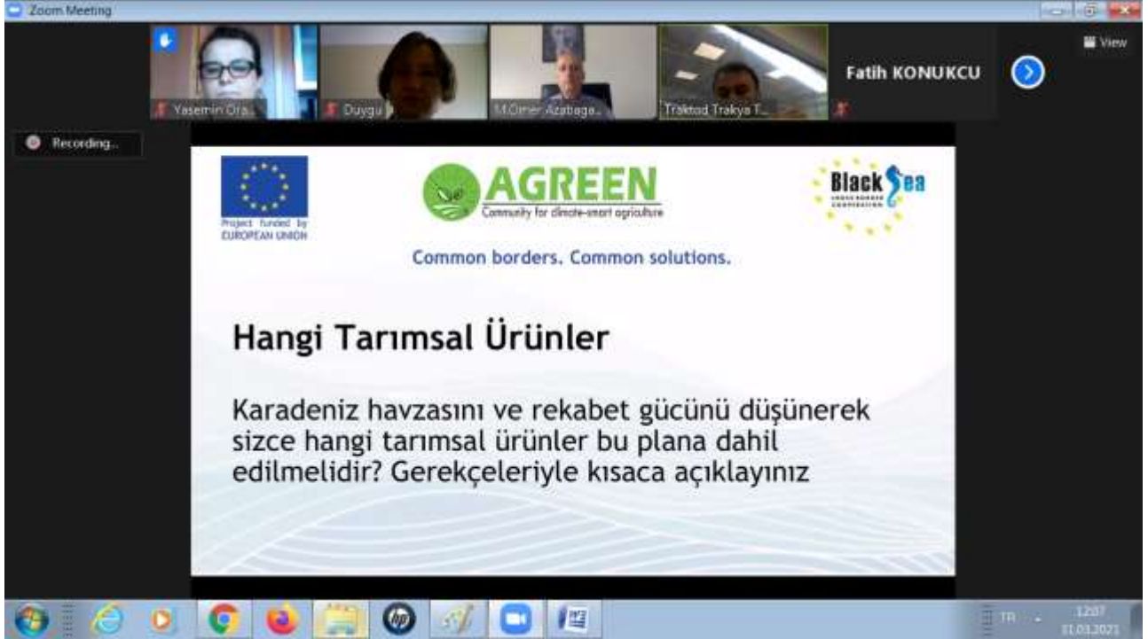
Ekran Görüntüsü 5