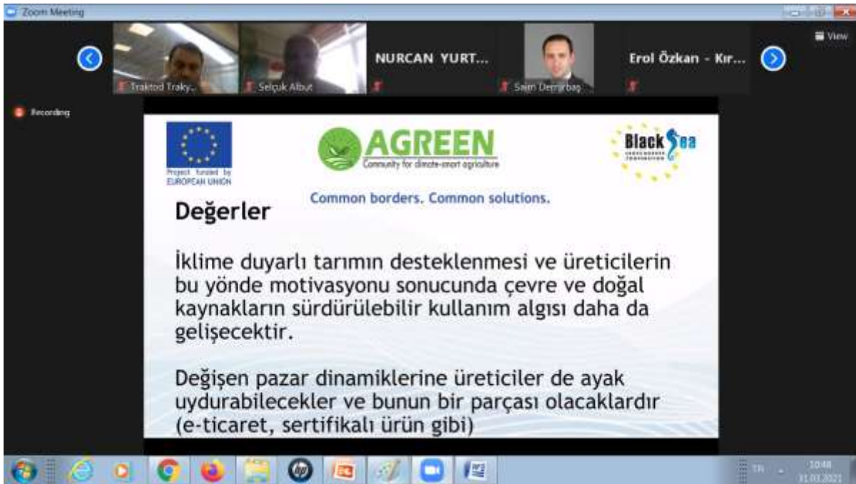
Ekran Görüntüsü 2